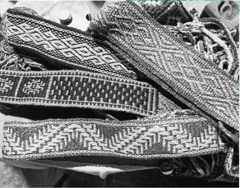
Trariloqko, Telar tejido por el chachay Erwin Quintupi